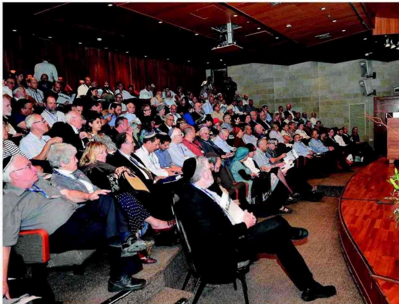
הגיע הזמן לעבור מאסכולת הטרקטור והמחרשה לכיוון חדש. באי הכנס

החתיישבות ביורה ושומרון החלה היטב לשורות הרור הצעיר של המתיישבים. "ניקח לדוגמה אדם גורמטיבי, שמר חוק מתלאביב", מסביר סמטורין, "ברור שאם הוא רתפוס את היישובים ככלתי ואת המתיישבים כעבוינים הוא לעולם לא יוכל לתמוך בכך".