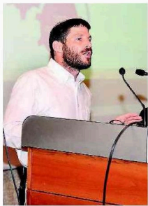
נורה אוזמה להתיישבות. סמוטריץ'

מרכז 'אדם ואדמה' שנפתח בשבוע שעבר והספר על דיני המקרקעין ביהודה ושומרון שהושק בו הם עוד סממן לשינוי העמוק שעובר על ההתיישבות ביהודה ושומרון • עם הזמן מתברר שנקודת ההכרעה על גורל ההתיישבות נמצאת בתחום המשפטי ובלגיטימציה שלה מבחינה בינלאומית • חבל שדווקא ראשי ההתיישבות, שנעדרו מן הכנס, טרם הבינו זאת